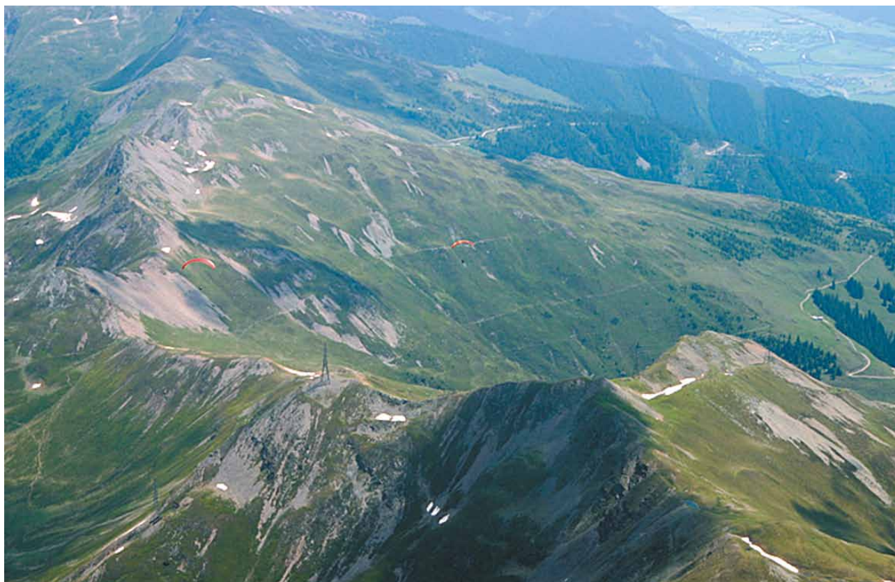
4.13 Někdy přechází elektrické vedení napříč přes kopce. Při pohledu shora je těžko viditelné, doufejme, že na ně energetici v problematických místech nainstalují lépe viditelné červené koule.